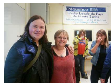
Une réflexion européenne intergénérationnelle – Inter-generational european collaboration