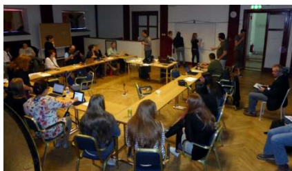
Meeting in Eskilstuna, Sweden

* Notre groupe considère que l'apprentissage non formel doit intégrer des «objectifs d'apprentissage».